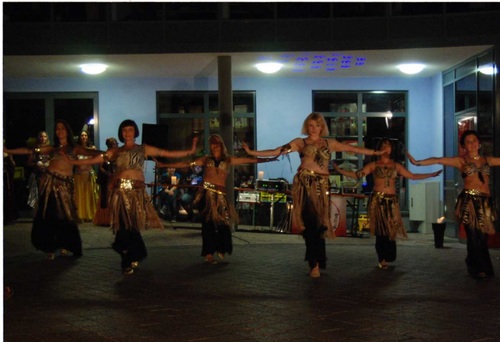
Die verschiedenen Tanzgruppen des TSC verzauberten die Gäste.