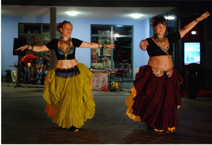
Aufwendig gestaltete Kostüme gab es zu sehen.

Abend ein sommerliches Getränk, den „Orientalischen Hugo“. Gegen 23 Uhr rundete das Finale mit einem Schleiertanz den gelungenen Abend ab. Ende des Jahres, im November findet eine weitere orientalische Nacht statt.