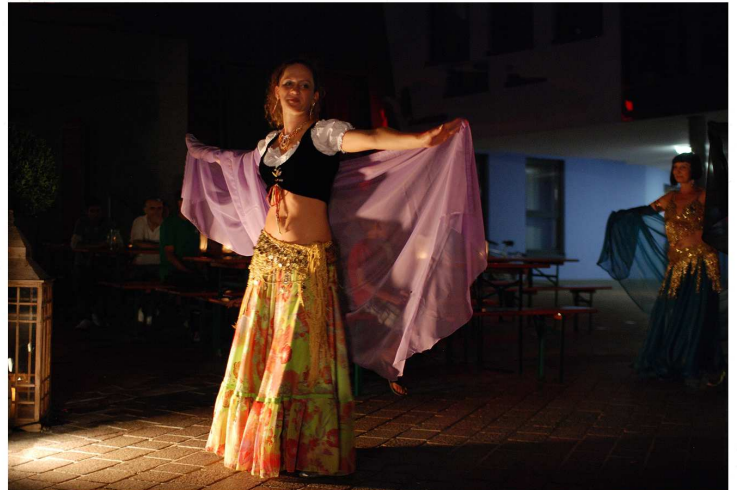
Die Besucher bekamen einiges geboten.