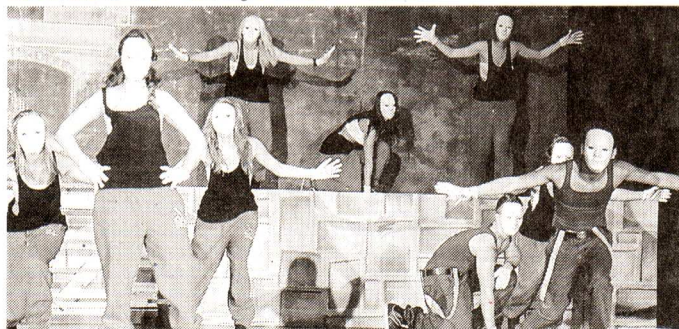
... als auch für alle HipHop Interessenten an.

Interessenten können jederzeit dazu kommen, die ersten beiden Trainings sind unverbindlich zum Schnuppern. Weitere Infos zu den neuen Trainings und dem TSC finden Sie unter www.tsc-dingolfing.de oder Telefon 08731/329328.