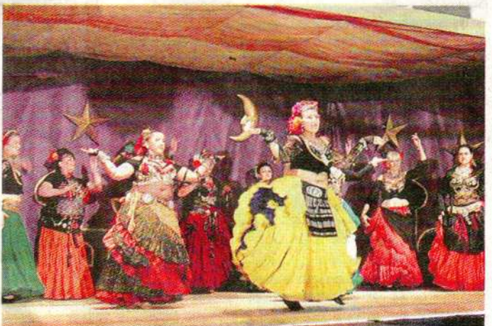
Als stolze Wüstentöchter stellten sich die Tribal-Gruppen Runa Bena und Alegria vor. - Bildergalerie im Internet: www.vilstalbote.de .