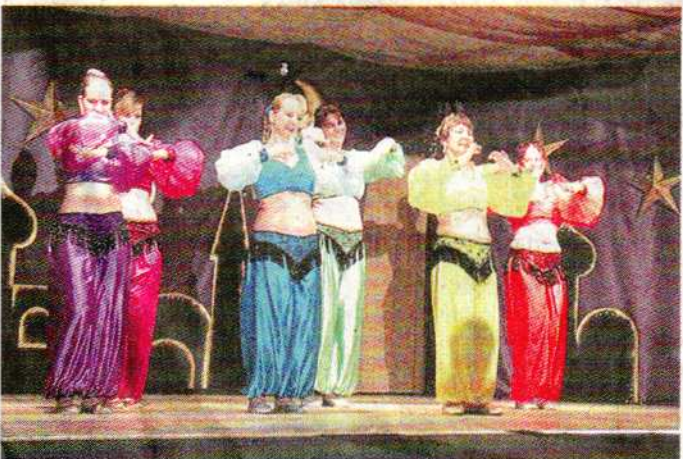
Die Gruppe Tantana als bezaubernde Jeannies.