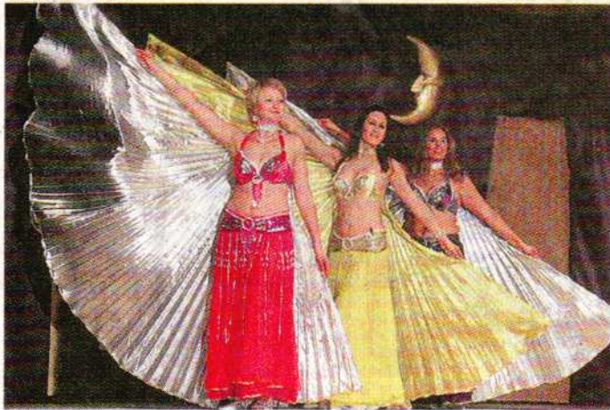
Ganz bezaubernd: Die Gruppe „Al Hadiye“ mit den Isis-Flügeln.

Orientalische Nächte der TSC-Bauchtänzerinnen begeisterten das Publikum Rund 50 Mitwirkende zündeten ein Feuerwerk orientalischer Tänze