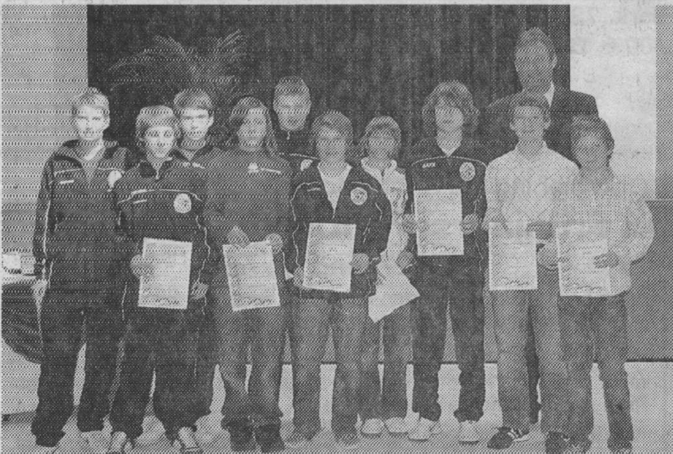
Diese Jugendlichen sind auf Niederbayernebene erfolgreich gewesen.