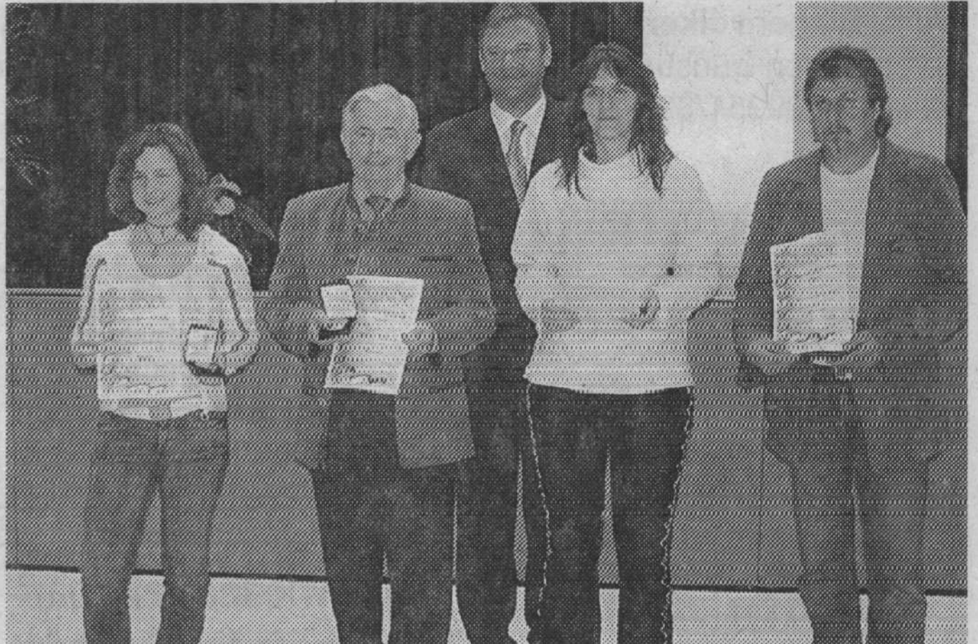
Auch Bayerische Meister wurden geehrt.

Leistungen spornen ganz offensichtlich an, stellte Pellkofer fest, da es viele junge erfolgreiche Sportler gebe. Andererseits würde dies auch bedeuten, dass die Vereine sehr gute Jugendarbeit betreiben. In den Sportvereinen seien nicht nur junge Menschen, Kin-