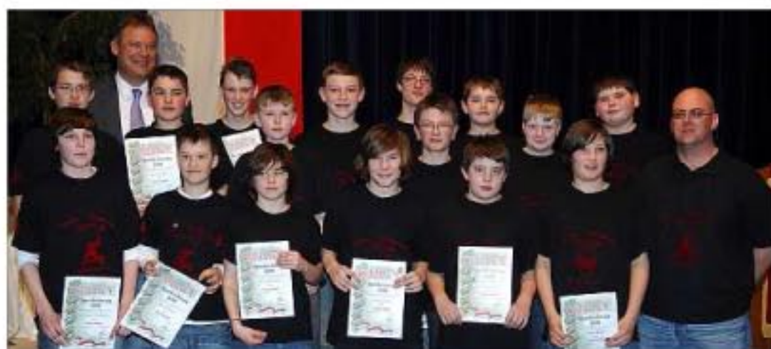
Die Knabenmannschaft des EV Dingolfing wurde niederbayerischer Meister in der Bezirksliga.