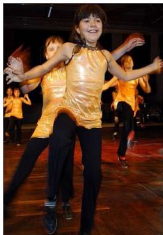
Die Rock'n'Roll-Gruppe des TSC sorgte für Unterhaltung.