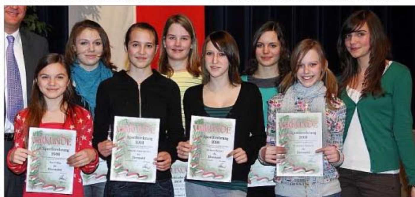
Der Pferdesportverein Dingolfing gewann die Leistungsklasse L bei ndb./opf. Meisterschaften und stieg in die M-Klasse auf.