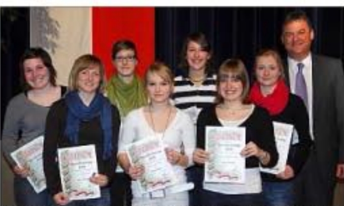
Die niederbayerischen Meister des Turnvereins Dingolfing.