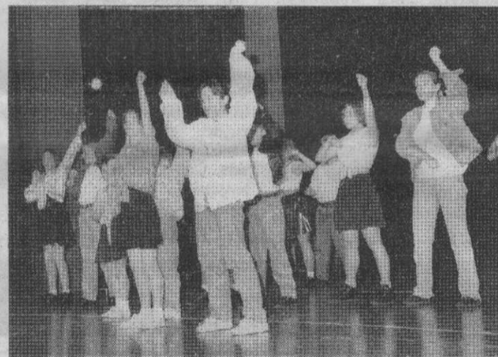
... ob Musical „Elisabeth“, Fetziges oder „Grease“...