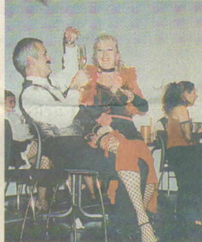
Sektlaune am Rande