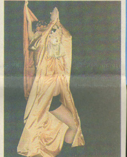
Cirque du Soleil