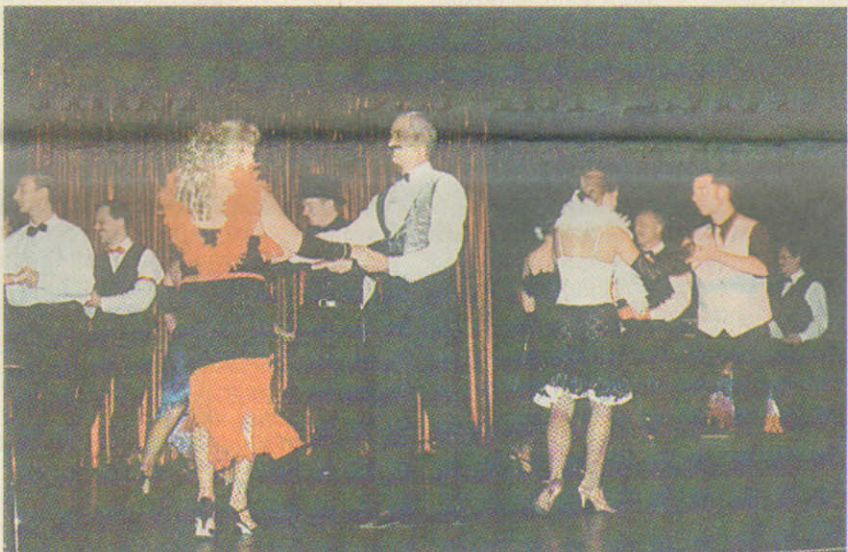
Eins, zwei Cha-Cha-Cha