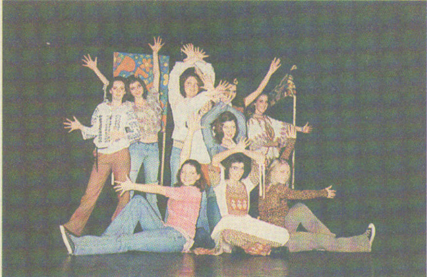
Flower Power bei „Hair“