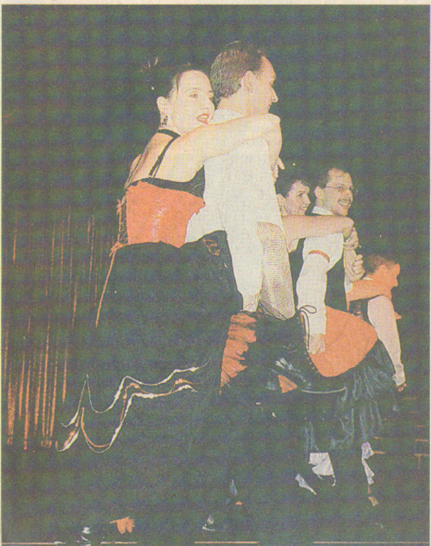
Aufwendige und verruchte Kostüme bei Moulin Rouge