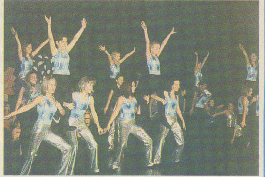
Hebefigur für das Schlußbild