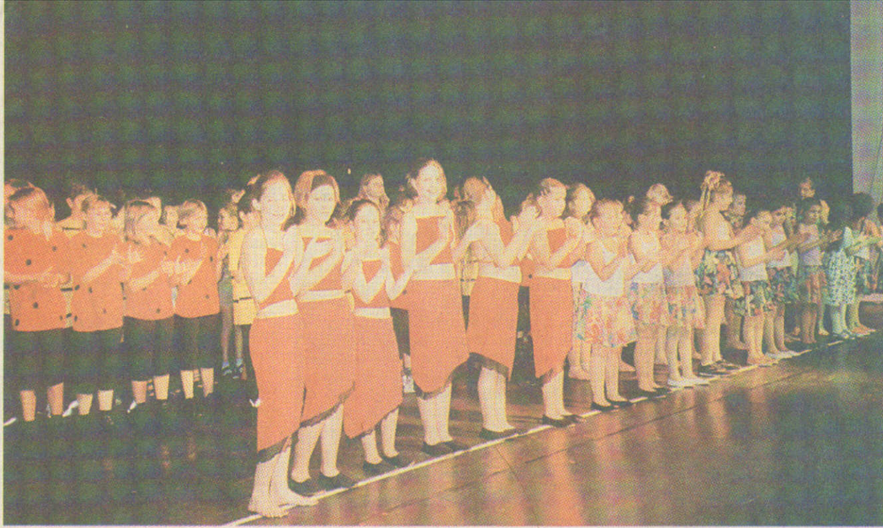
Zum großen Finale kamen nochmal alle Tänzerinnen und Tänzer auf die Bühne