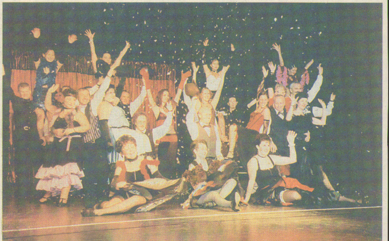
Flitterregen für die Tänzer von „Moulin Rouge“